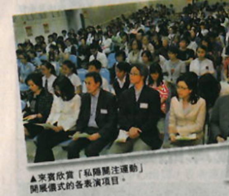
▲來賓欣賞「私隱關注運動」開展儀式之各表演項目。