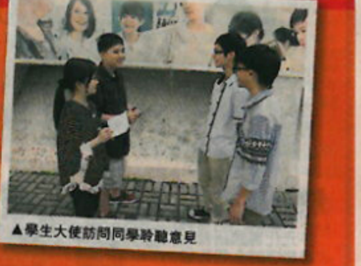
▲學生大使訪問同學聆聽意見

除了訪問公署代表外，我們還訪問了校內的輔導主任，以了解學校安裝閉路電視的理念及有無成效。據輔導主任指出學校在數年前的學校改善工程中，興建新翼大樓，當時考慮到保安及人手分配的情況，而決定在新翼樓層安裝閉路電視。除此，教職員室、電腦室及電梯內亦