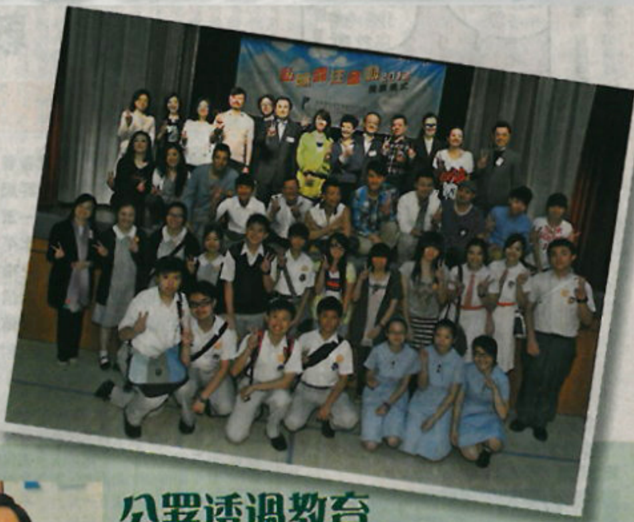
「私隱關注運動」開展儀式之熱鬧情況。

今屆運動的推廣對象是年輕人，口號是「在線與離線私隱 同樣重要」，鼓勵年輕人上網時，特別是使用社交網站時，要小心保護個人資料，詳情請瀏覽公署網頁 www.pcpd.org.hk 。2,000多名來自42間中學的學生（見下表）參加了「保障私隱學生大使」計劃。在2012運動舉行期間，分別以短片、話劇、新聞報道等不同形式，在校內向同學宣揚保護個人資料私隱。當中來自庇理羅士女子中學及聖公會李福慶中學學生的作品，獲選為私隱關注新聞故事的優秀作品（詳見另文）。