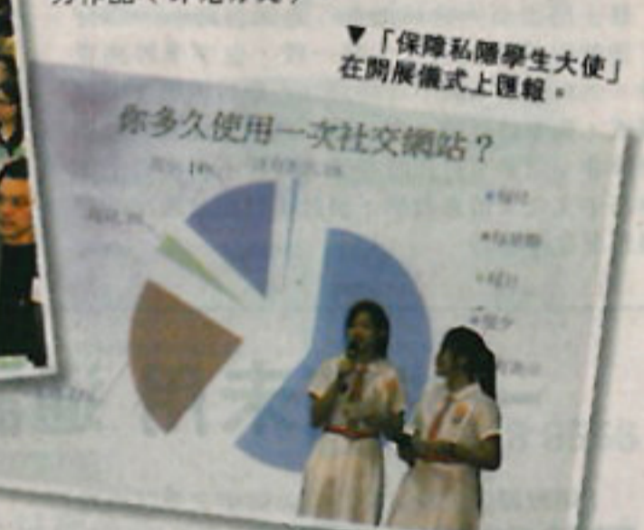
▼「保障私隱學生大使」在開展儀式上匯報。