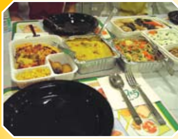
眼前的飯盒將是同學來年的飯盒模式