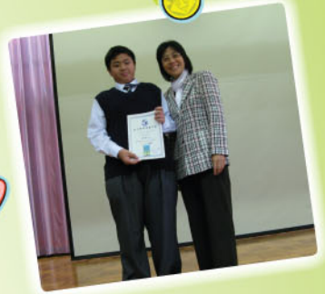
「學生應有的責任」作文比賽冠軍