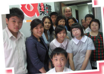
視察完廠房後，讓我們來一張大合照！