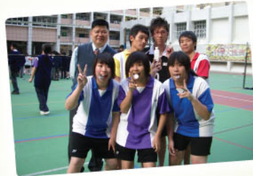
高級組班際排球混合賽 - 5D獲獎