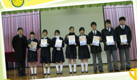
海洋公園保育義工服務獎