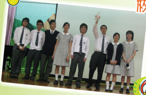
E-THINK AGAIN AWARD