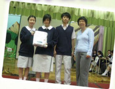
中一唐詩問答比賽冠軍