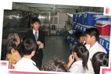
同學們很主動發問有關飯盒的製作過程，因他們才是最大的消費者

6月27日中午，9位家長、12位老師及20位同學聚首一堂，目的是為了挑選下學年的午膳供應商提出意見！試餐當日，氣氛很熱鬧，因各位家長及師生們在試食之餘，亦不斷對各食品加以評價，給予我校很多寶貴的意見。另外，我校亦安排家長和師生參觀了供應商的生產廠房；經商議後，終於選擇了樂膳有限公司為來年的供應商。每年參與試餐的家長人數也在上升，未知明年能否見到你與子女的參與呢？