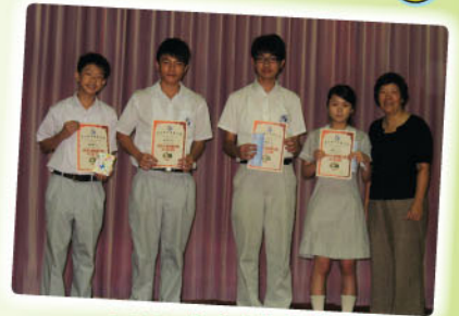
2008 成功人物短講比賽