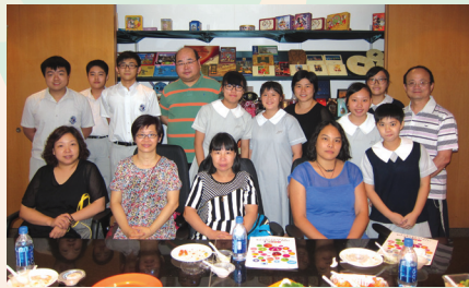
參觀美思廠房後大合照

一年一度挑選下學年的供應商於5月起正式展開招標！在6月20日，我校進行了試餐會。當日共有7間供應商參與，試餐會內近80位家長、老師及同學為飯盒提供意見和評分。經統計分數及評估各方面條件後，首輪選出「美思餐飲服務有限公司」。跟着，是作廠房實地考察。家長教師會的家長幹事、家長、老師和學生代表一行十五人前往位於大埔的廠房進行考察，以了解公司生產飯盒的運作過程及廠房衛生情況。最後，各人一致滿意，故向校方推薦「美思餐飲服務有限公司」為我校2013/14的午膳飯盒供應商。在此，感謝各家長對供應商提出的詢問和意見，更希望來年能繼續跟進，為同學們的營養健康多提供寶貴意見！