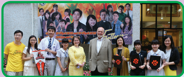
張校長及師生與由美國到校探訪的「啟發潛能教育」專家合照

有勇氣去改變，才能突破與超越，我們常說「開」、「停」、「保」和「改」是：為未發掘的未來去「開展」；為現有卻是不好的，去「停止」；為已有卻未是最好的，去「改善」。原來，有勇氣去改變，亦要有勇氣不去改變——為已有而很好的，要「保持」下去。