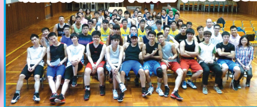
六隊參賽隊伍賽前合照