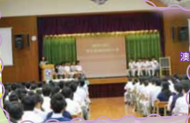
學生會選舉諮詢大會