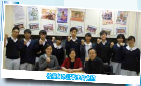
校長與本屆學生會合照