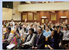
會員投票表決當日的議程