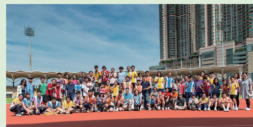
各參加者的笑容令人感受到「為善最樂」

有兩位領袖生很有禮貌地接待我到看台上的家長召集處，一邊欣賞比賽，一邊等候參加下午的慈善競技賽。不久，陸運會各項比賽相繼舉行。只見看台上的同學和啦啦隊非常落力地為場上的健兒打氣，好不熱鬧。