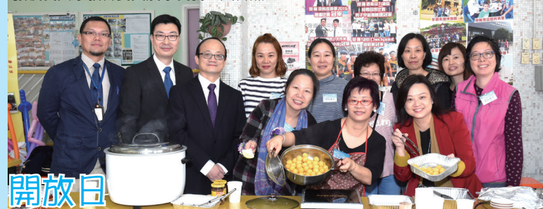
張校長與家教會委員及家長義工大合照