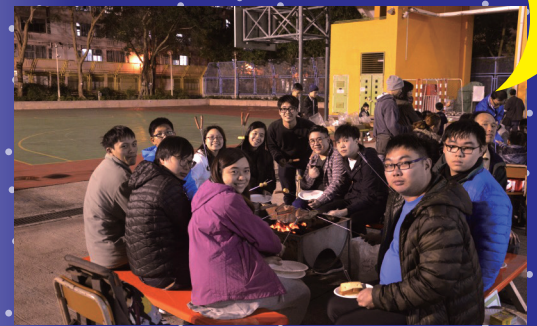
校友大談昔日校園趣事