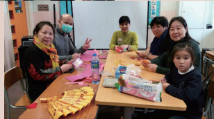
「輕談淺嚼」攤位大受開放日來賓歡迎，全賴各家長義工的努力。