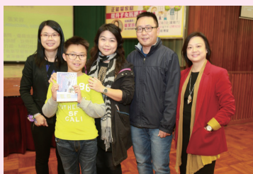
張笑容女士與張校長及聽眾人士合照