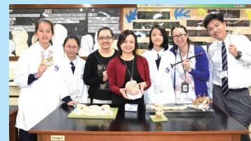
各科組舉辦有趣的活動