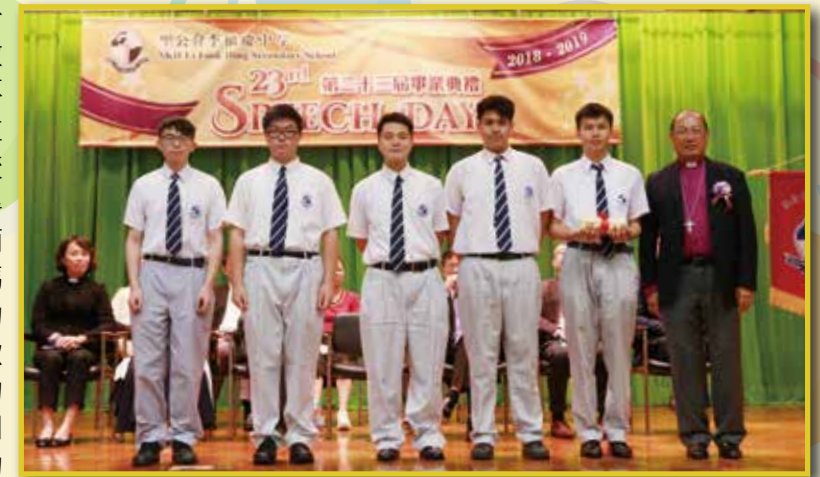
鄭保羅大主教親臨本校致訓及授憑

聖公會李福慶中學第二十三屆畢業典禮已於 2019 年 6 月 28 日圓滿結束。承蒙鄭保羅大主教蒞臨主禮及致訓，鄭保羅大主教以聖經箴言：「不可使慈愛、誠實離開你，要繫在你頸項上、刻在你心版上。」作為對畢業生之訓勉，同時以本校的核心價值「良善恩慈」、「誠實可靠」勉勵畢業生在人生道路上要秉持「慈愛」和「誠實」兩種素質。接着，鄭大主教援引阿里巴巴創辦人馬雲對青年說的道理鼓勵畢業生，做事應抱樂觀的態度，堅持實踐理想。鄭大主教再以香港著名歌手張學友說的一席話勉勵畢業生，只要有足夠的愛，便可以不怕艱難，不計回報地完成工作。因此，良善慈愛能成為大家克服困難，向前邁進的動力。鄭大主教再叮囑同學要以古人「至誠」的標準來規範自己，建立和他人互信的良好關係。在上帝和勢力眼前，除了要成為一位有學識的人，還要成為一位滿有慈愛和誠信的人。