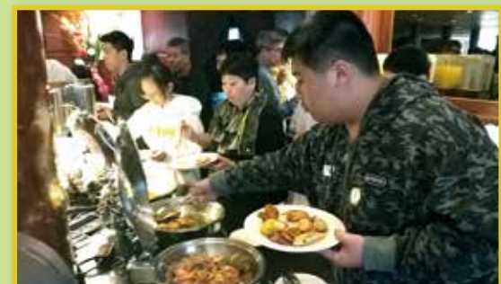
美食當前，團友食指大動。