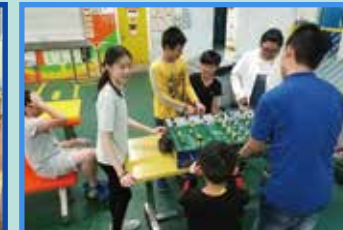
不同家庭聚首一堂，共度歡樂時光。燒烤以外，盡情遊戲，增進情誼。