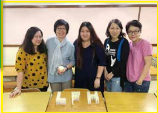
與家長義工們製作天然驅蚊膏