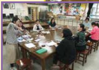
導師正在講解製作皮革鑰匙包的工序。