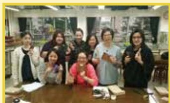
拿着製成品，心滿意足。

至於皮革鑰匙包，我們跟從導師的教導，一步一步把原材料製作成獨一無二、具個人風格的鑰匙包。過程中我知道只要用心製作，任何人都可以得到認同，最重要的是付出過努力，便應該得到肯定。從中我也明白到孩子的感受，因為我的製成品得到兒子的認同和欣賞，令我非常欣慰。將心比己，孩子渴求的，不過是父母給予的認同和讚賞吧！