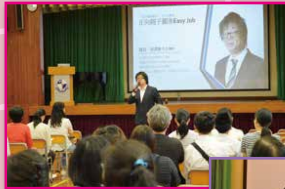
家長們專心聆聽講解

另外，本年度家長教師會亦向家長派發有關情緒管理教育的單張，主題包括「壓力不可怕」及「自我鬆弛法」。家長反應正面，本會來年會再為家長提供更多有關情緒管理的資訊，協助家長建構更正面、更親密的親子關係。