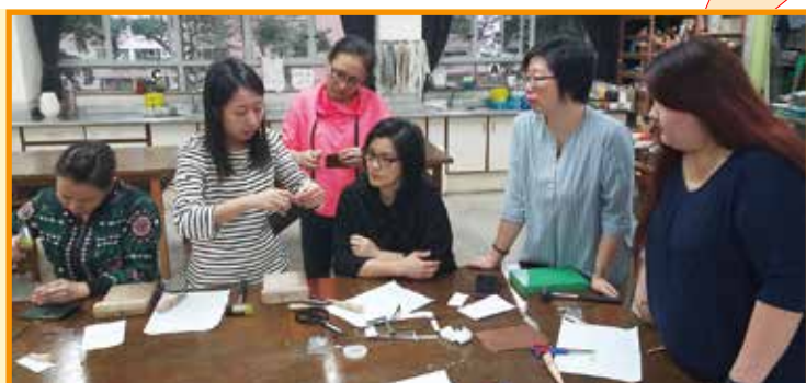
工序細緻繁瑣，大家都非常謹慎。