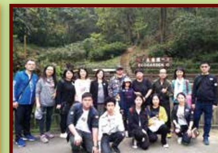
在蝴蝶生態園找尋蝴蝶的蹤跡