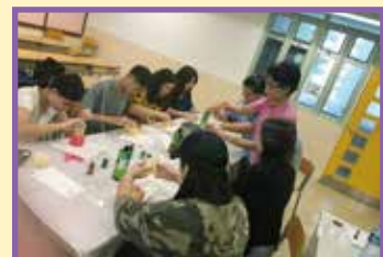
動手製作天然驅蚊膏，保障自己、家人及朋友的健康。

我參加了家教會舉辦的「天然驅蚊膏」及「皮革鑰匙包DIY」興趣工作坊，真的獲益良多。炎炎夏日，正是蚊子肆虐的季節，大家都需要預防蚊患。親手製作天然無害的驅蚊膏，既能保障自己、家人和朋友的健康，又能增加親子時間，更能知道製作驅蚊膏的技巧，簡直是一舉三得呢！