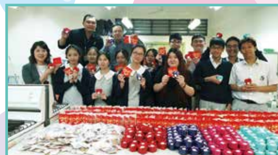
每份香皂花或曲奇都夾附心意卡，讓同學寫上對父母的謝意。

學生透過是次義賣學習到籌劃活動的技巧，得到深刻體會。承蒙家教會的協助，大家充份發揮團隊精神，讓活動得以順利完成。