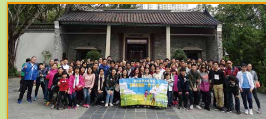
一行百多名師生、家長，在九龍寨城公園留影。

3月17日是家教會舉辦一年一度「親子旅遊」的日子，當日行程既精彩又豐富。我們首先參觀九龍寨城公園，沿途欣賞清初江南園林設計，亦不忘拍照留下美好一刻。然後大家到君怡酒店一邊享用美味自助餐，一邊暢談增進情誼，團友都大快朵頤。午飯後，我們前往雷公田、蝴蝶生態園及農場鮮奶園，飽覽大自然美景及品嚐鮮奶製品，部分同學更親手餵飼小羊，體會照顧動物的樂趣。最後大家參觀冠華食品廠，部份團友更為家人添購涼果小食，樂也融融，大家共度了一個溫馨而愉快的下午。