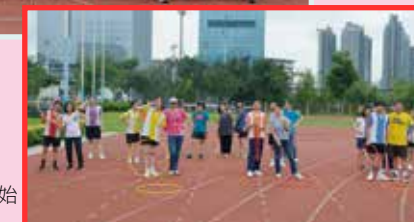
競技賽開始前留影