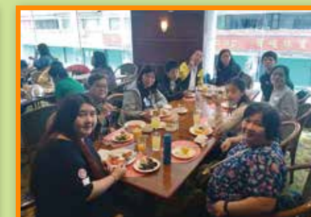
一邊品嚐美食，一邊暢談生活，享受輕鬆時光。