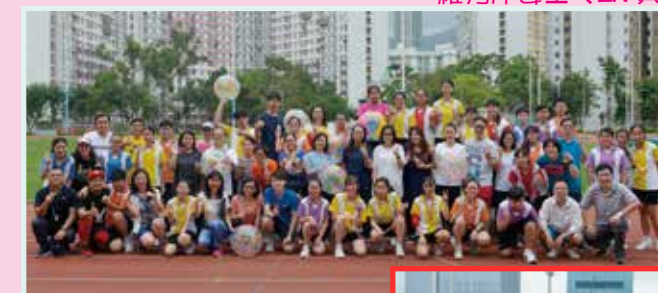
家長、師生聚首一堂，為慈善不遺餘力。