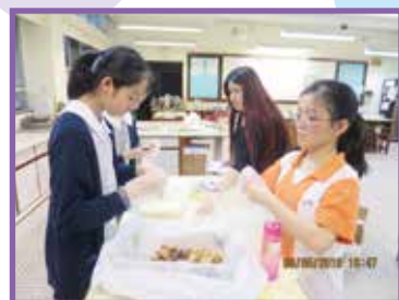
家長和學生們正在包裝曲奇