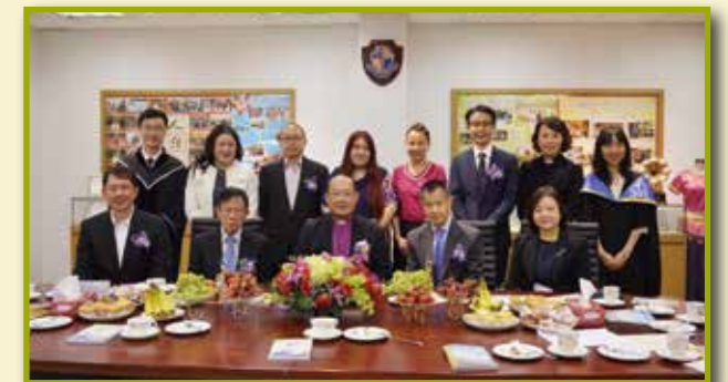
鄭保羅大主教與畢業典禮嘉賓合照