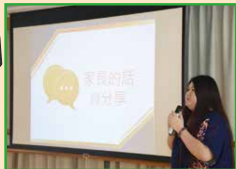
在開放日「升中資訊講座」中分享

「我們曉得萬事都互相效力，叫愛神的人得益處，就是按他旨意被召的人。」(羅馬書 8:28)