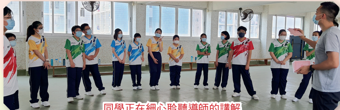
同學正在細心聆聽導師的講解