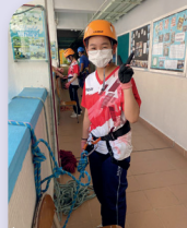
「緣繩下降」活動是勇氣及膽量的大挑戰