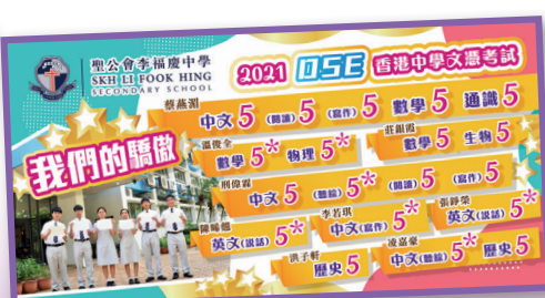
本校不少同學於2021文憑試考獲佳績