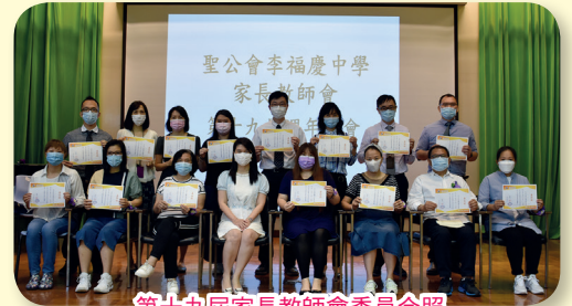
第十九屆家長教師會委員合照

其後，家教會會員表決通過第十八屆家長教師會會務報告、財務報告及第十九屆家長教師會常務委員會委員名單。投票過後的環節是中一及中四家長會，家長到課室與班主任進行面談，班主任先介紹班中活動及反映學生情況，再與家長互相交流。在此，多謝各位家長支持家教會及學校工作，我們定當繼續推動家校合作，讓我們的孩子愉快成長。