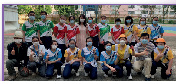
師生樂也融融，共同享受「全方位學習日」。