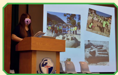
曾主席在會員大會上分享過去一年的精彩活動