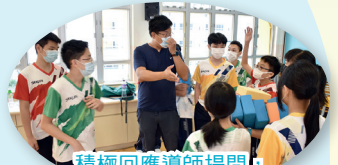
積極回應導師提問，是中一同學最令入欣賞的。