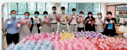
家長們及師生努力為數百份心意包作包裝