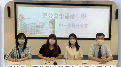
吳校長、兩位副校長及曾主席共同主持分享會