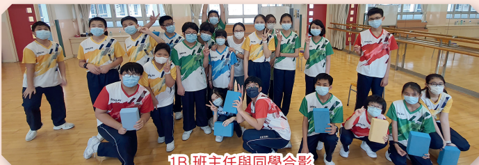
1B 班主任與同學合影

女兒入讀聖公會李福慶中學已一年了。由於女兒病情反覆，這半年需要經常請假回醫院治療，令她承受非常大的情緒壓力。當兩位副校長知道女兒情況後，馬上安排一系列措施幫助她，讓她感受到學校的溫暖，重拾自信。在此我非常感激校長、副校長、老師們以及社工的無限包容、愛心及關懷。