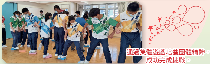
通過集體遊戲培養團體精神，成功完成挑戰。