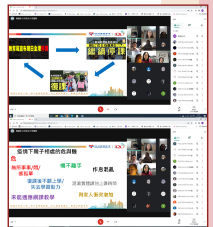
PTA全校家長網上分享會