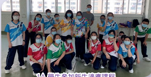
1A 學生參加新生適應課程