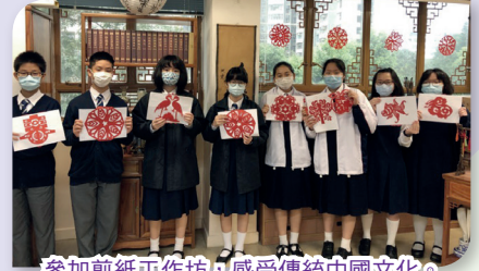
參加剪紙工作坊，感受傳統中國文化。