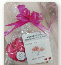
心意包內有肥皂花、搓手液、心意卡及寧神茶包

儘管活動時間緊迫，但我們仍然成功將心意包送到全校師生的手中。在疫情之下，非常感恩學生會依然可以把握機會，盡最大努力為師生服務；也讓同學向父母親表達自己的心意，讓雙親在這專屬的日子裏收到兒女親手送上的禮物，一同感受溫暖的家庭氣氛。