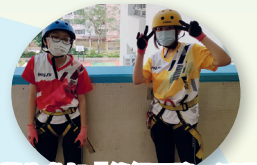
學生參加「緣繩下降」活動，挑戰自己，衝破極限。

受新冠肺炎疫情的影響，回校上課已變成非常態。對於剛升中的小兒來說，既要適應新學校環境，又要適應不一樣的學習模式，實在不容易！藉此感謝校方努力完善各種安排，協助剛升中的學生和家長適應新環境和新常態教學，尤其是班主任和老師們貼心的照顧和教導。記得開學初時，兩位班主任已第一時間給予家長電話號碼，好讓家長隨時聯繫，這令我非常感動和安心！更令我欣喜的事情是在網課時，看到老師對學生的循循善誘和關懷，讓孩子感受到老師的愛和鼓勵，愛上學習。最後，很感恩能成為貴校的一份子，我們會繼續努力，謝謝大家。