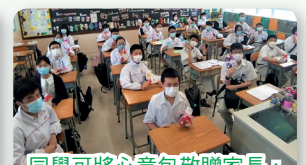
同學可將心意包敬贈家長，表達謝意。