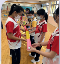
同心協力，齊齊把球運到終點！

受制於疫情關係，今年學校未能舉辦太多課外活動。希望疫情快些緩和，同學能藉着多參加活動，了解自己的方向，努力向理想進發。