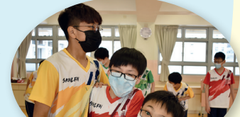
經過幾天的適應課程，同學已經建立深厚的友情。