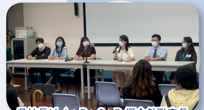
吳校長以A、B、C、D概念勉勵家長