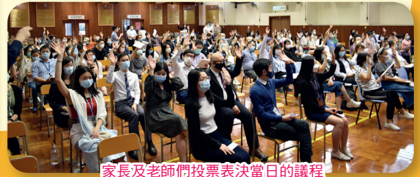
家長及老師們投票表決當日的議程