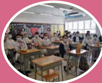
學生將鮮花帶回家敬贈父母，聊表心意。