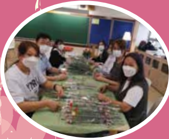
鮮花經過家長及師生的巧手包裝，變成一份份精緻的禮物。

這次我有幸參與包裝工作，看到師生們分工合作，努力包裝，發揮團隊精神，很快便完成了數百朵鮮花的加工工序。希望各位家長和師長會喜歡這份小心意，亦多多支持家教會舉辦的活動。