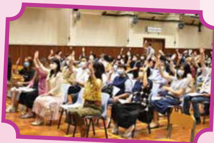
出席會員舉手表決通過當日的議程

其後，家教會會員表決通過第十九屆家長教師會會務報告、財務報告及第二十屆家長教師會常務委員會委員名單。投票過後的環節是中一及中四家長會，家長到課室與班主任進行會面，班主任介紹班中活動及反映學生情況，與家長互相交流。在此衷心感謝各位家長支持家教會及學校工作，我們會繼續推動家校合作，讓我們的孩子愉快和充實成長。