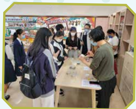
家長義工對來賓講解製作步驟