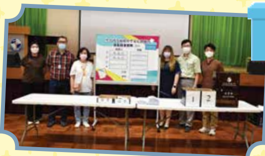
家長校董選舉結果出爐

2022年9月及10月家教會將分別舉行法團校董會家長校董選舉及第二十一屆家長教師會家長委員選舉，家長可透過自薦或由他人提名參選。成為家教會委員可促進家校之間的聯繫及溝通，透過家校緊密合作，共同為學生建立和諧及愉快的學習環境，讓子女在學業和身心各方面健康成長；而參選家長校董更可與其他校董共同制訂學校的政策，議決發展項目的優次，提升學生的學習成效及豐富學生的校園生活，以實踐學校的教育理念。在此，誠邀家長屆時積極提名參選人或自薦為參選人，期望得到家長更多支持，協助學校發展。