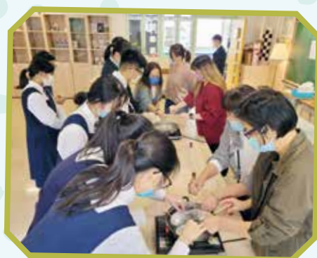
工作人員正把合比例的材料加熱至充分溶解及混合