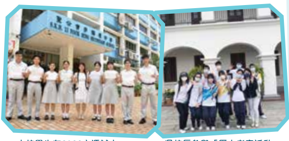
本校學生在2022文憑試中 喜獲佳績