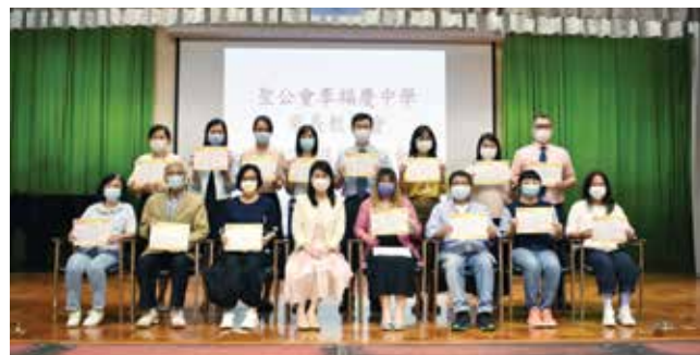
第二十屆家長教師會委員合照