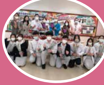
家長及師生同心協力，包裝好數百朵鮮花。