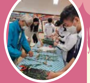
家長及師生正努力進行包裝工序。