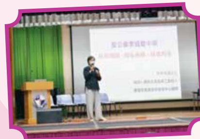
何尹美儀女士到校主持專題講座