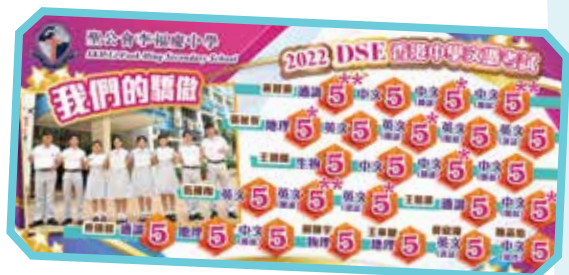
不同科目均有學生考獲5-5**成績

雖然疫情的陰霾仍在，但學生們學會在逆境中自強不息的精神，以正面的態度迎難而上。誠願在我們家校攜手、互勵互勉下，孩子們可以尋找到讓他們發揮的平台，自信地展現亮點。我校定必繼續努力，創造不同的多元學習機會，用愛培育每一位孩子，讓他們能發光發熱！