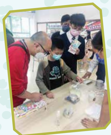
小朋友親手製作精油潤脣膏