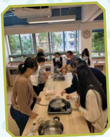
上下一心，製作天然潤脣膏致送來賓。