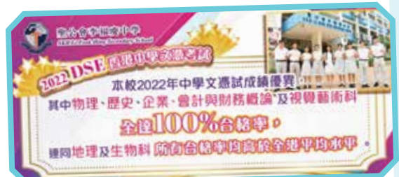
本校多科合格率均高於全港平均水平，成績令人鼓舞。