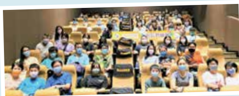
參加者於第一場電影播放前拍照留念

在這幾年疫情的陰霾下，家長、學生、老師都承受着不同的情緒及壓力。通過觀賞電影，參與者得以放鬆身心，更感受到家長教師會對家長們的關懷與支持。