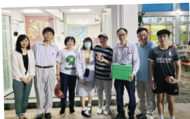
家教會、學生會、校友會分別送出禮物作抽獎

受疫情影響，今年終於得以復辦大家期待已久的燒烤晚會。燒烤晚會由本校學生會、校友會及家長教師會於5月25日晚上聯合舉辦，當晚參加人數眾多，近百位參加者難得聚首一堂。節目及食物皆非常豐富，除了燒烤外，還有抽獎、棋類活動、球類活動及大合照，氣氛熱鬧中又帶點溫馨。學生會、校友會及家長教師會分別各自送出三份禮物，獲獎幸運兒都滿心歡喜。大家圍爐暢聚，樂也融融，度過一個美好晚上。