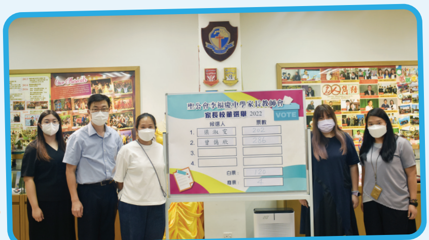
候選人一同見證家長校董選舉結果