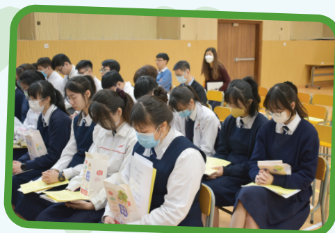
學生依指示低頭禱告