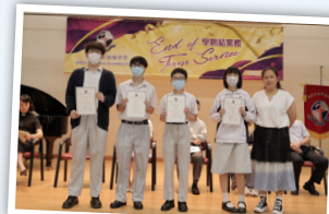
中國語文科進步獎領獎生