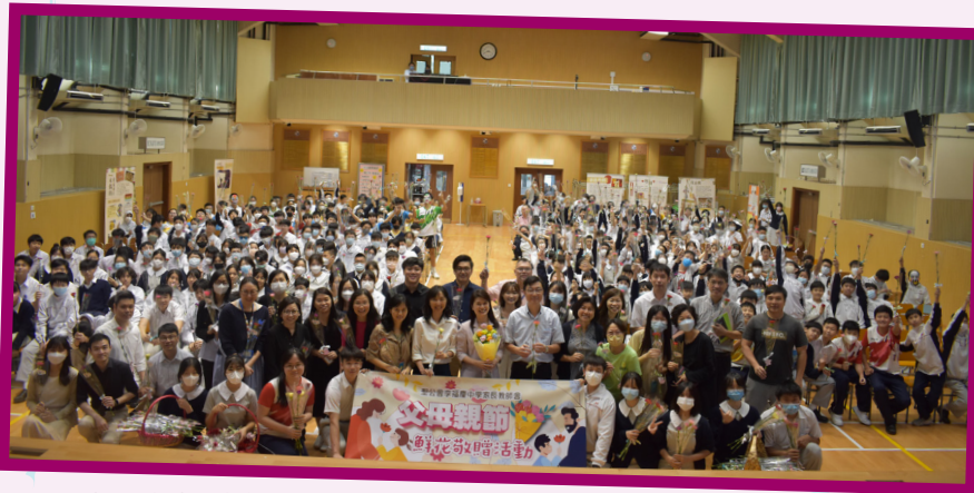
學生同時對老師表達謝意