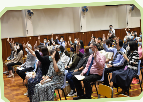
出席會員舉手表決通過當日的議程