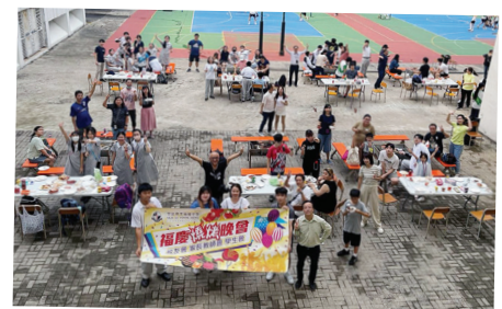
近百人參與活動，場面熱鬧