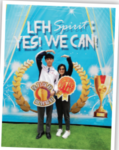
最合拍大獎季軍——5S麥展朗