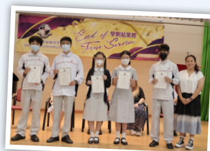
英國語文科優異獎領獎生