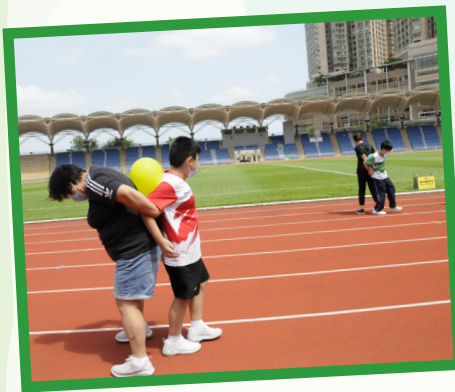
除了速度，競技賽也講求默契，傳球可不容易呢！ 各組勢均力敵，實力不相伯仲。