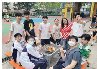
燒烤晚會凝聚了不同年級的學生與家長