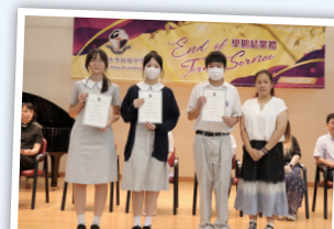
公民與社會發展/生活與社會科進步獎領獎生