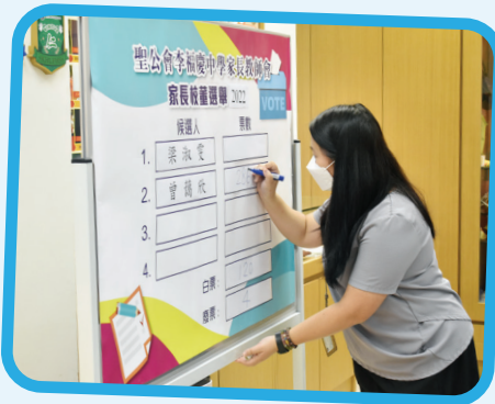
教師協助點票工作

2023年9月及10月家教會將分別舉行法團校董會家長校董選舉及第二十二屆家長教師會家長委員選舉，家長可透過自薦或由他人提名參加選舉。成為家教會委員可促進家校之間的聯繫及溝通，建立夥伴合作關係，透過統籌及舉辦各類親子活動，共同為學生建立和諧及愉快的學習環境，讓子女在學業和身心各方面健康成長；而參選家長校董更可與其他校董共同規劃學校的發展方向，議決發展項目的優次，計劃和管理學校可運用的資源，培養學生樂於學習的風氣，豐富學生的校園生活，以實踐學校的教育理念。在此，誠邀家長屆時積極提名參選人或自我提名為參選人，期望得到家長更多支持，協助學校發展。