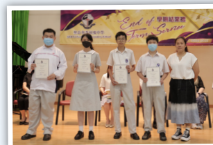
英國語文科進步獎領獎生