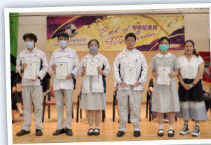
數學科優異獎領獎生