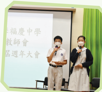
中一學生擔任小司儀，表現傑出。