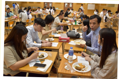
參加者試食後即場填寫評分表