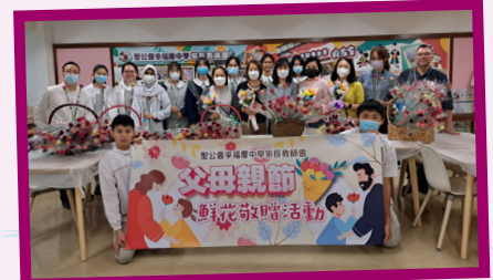
家長及師生同心合力，一個下午包好數百朵鮮花。