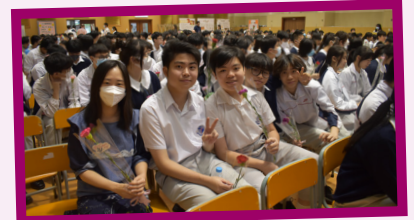
學生把禮物帶回家送給父母，以表心意。