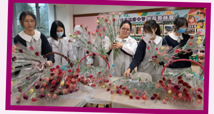
學生為鮮花綁上精美包裝