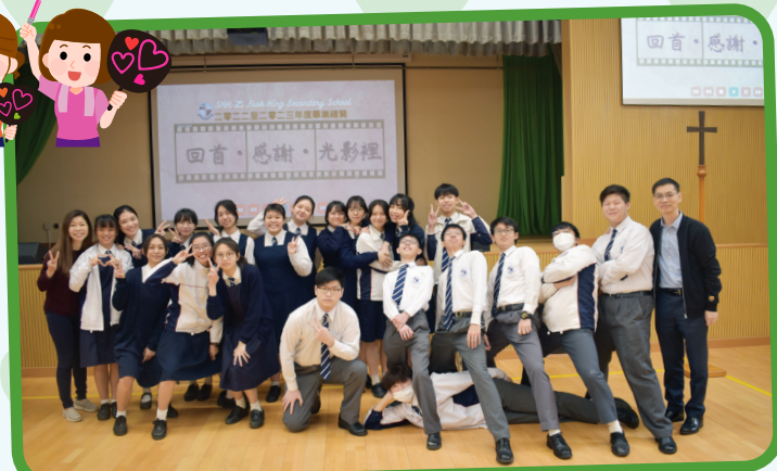
每一幅合照，都是一段重要的回憶。

不經不覺又到了中六生準備迎戰文憑試的日子。家教會今年精心訂製了五星圖案匙扣送給每位中六考生，匙扣上刻有每位中六考生的英文名字，背面亦刻上鼓勵字句“Never Give Up On Your Dreams”，希望考生們縱使經歷疫情的考驗，仍能努力不放棄，堅持追尋自己的夢想。祝福各位考生DSE能取得好成績，有一條美好順利的前路。