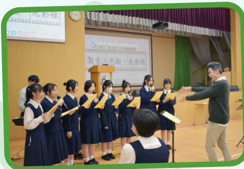
聖樂小組為中六學生送上祝福