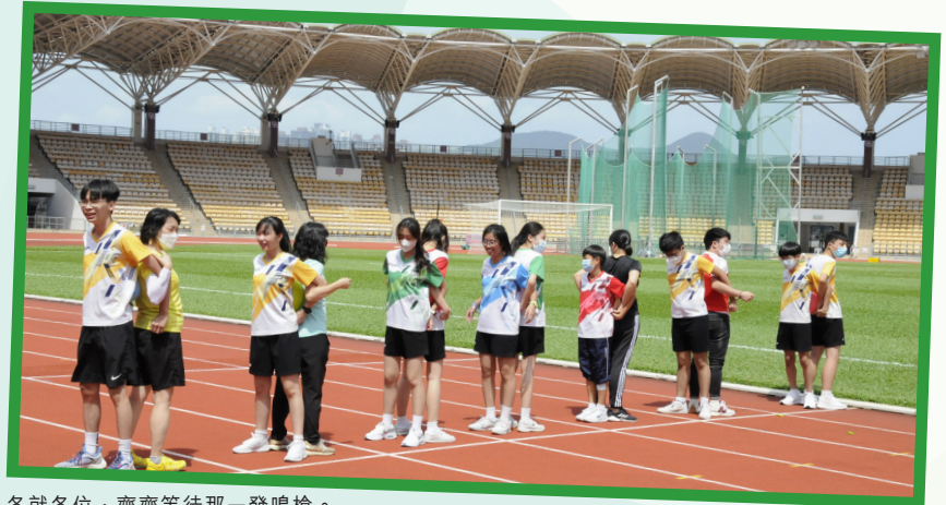
各就各位，齊齊等待那一發鳴槍。

比賽當日雖艷陽高掛，數十健兒仍拼盡全力向終點進發，大家不求名次，志在享受同心協力揮灑汗水的過程。賽場上歡呼聲、吶喊聲、打氣聲此起彼落，大家的臉上都洋溢着滿足的笑容。