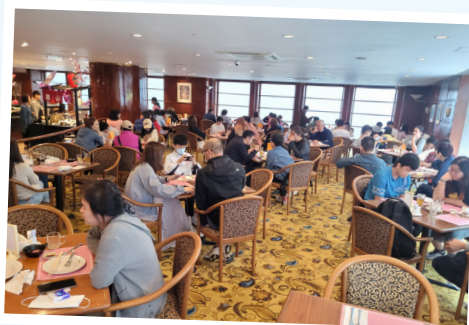
除了參觀，美食也是不可或缺呢！