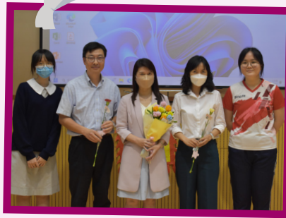
學生會代表致送花朵予校長及兩位副校長