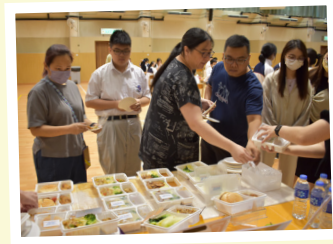
參與者逐一試食不同供應商的飯菜

6月15日下午，學校邀請老師、家委、家長到「鮮營餐飲服務」廠房參觀。廠房門口擺放消毒酒精及棄棄防護帽，每個人進入廠房前都要進行消毒並戴上防護帽，確保安全衛生。廠房麻雀雖小卻五臟俱全，環境整齊清潔。當日由負責人講解製作餐盒的流程，我們得知飯菜每天都是新鮮蒸煮，廠房預備的蔬菜、肉類都有安全來源保障，以確保每位學生都能吃到營養豐富的膳食。