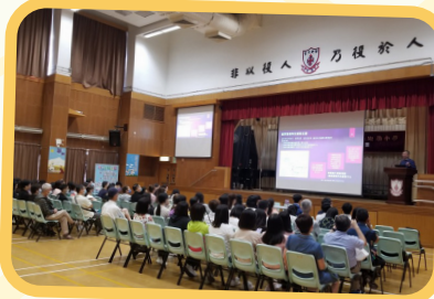
出席者都專心聆聽分享