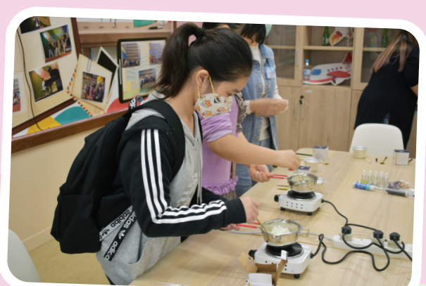
同學聚精會神地進行熔蠟工序