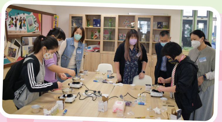
家委細心指導參加者製作蠟燭

學校開放日是每年一度的盛事，每年家教會都會準備一些活動給各位來賓參與，感受溫馨的氣氛。今年我們準備了「香薰告白蠟燭」，材料及做法都很簡單。家長和同學們都踴躍參與，細心設計屬於自己的蠟燭，看到他們拿着製成品時的喜悅，我都為大家高興。希望來年開放日能再遇見你們呢！