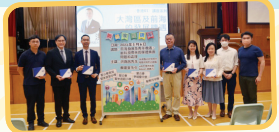
參與學校校長與洪為民先生留影

本校聯同三間聖公會學校合辦「聯校國民教育家長講座」，於5月6日假聖公會柴灣聖米迦勒小學禮堂舉行。當日主題為「前海發展及青年機遇」、「新科技帶來的媒體素養問題和處理」，分別邀請了洪為民先生及蘇建峯先生為大家講解及分享。聽眾投入講座，不時拿起手提電話拍攝講者簡報，記錄資料，家長亦透過積極發問，對主題內容有更深入的了解。參加者都對是次講座有正面的回饋。