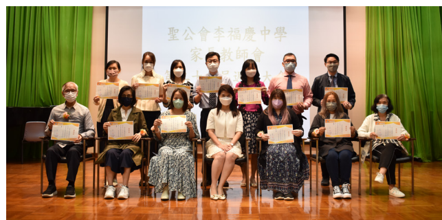
第二十一屆家長教師會委員合照