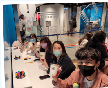
每位參加者可以親手製作獨一無二的杯麵