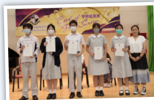
中國語文科優異獎領獎生