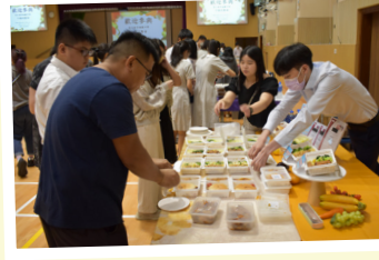
每間供應商都備有數款餐盒供試食