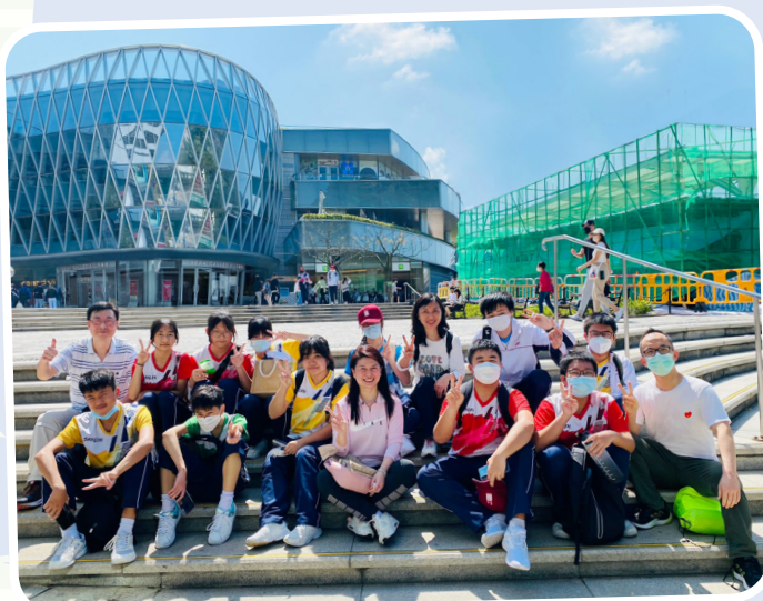
校長與同學們參加聖約翰座堂步行籌款後於山頂留影

經過三年多的疫情，社會回到正軌，校園生活亦隨之復常，全日面授課堂、課後補課、課外活動、各類型活動等都順利舉行。再一次感謝家長們在復常的道路上不斷與本校合作，並積極支持及參與我校舉辦的活動，當中包括工作坊、親子講座、家長日、親子旅行、燒烤晚會等等。感謝您們與孩子們並肩同行，時刻為孩子們提供適切的關懷和幫助。