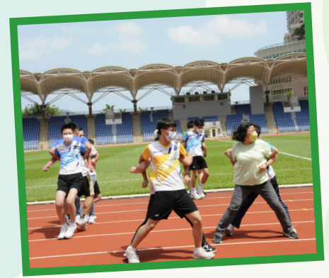
比賽健兒正奮力向終點前進