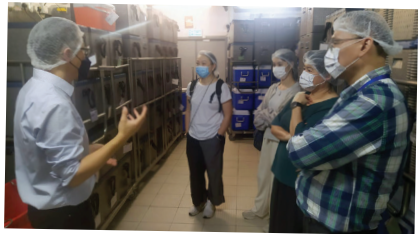
本校代表細心聆聽負責人講解餐盒製作流程